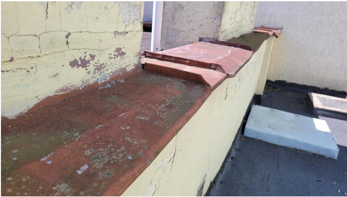
Fot. 5 Odróbki blacharskie attyk – skorodowane, zdeformowane i popękane