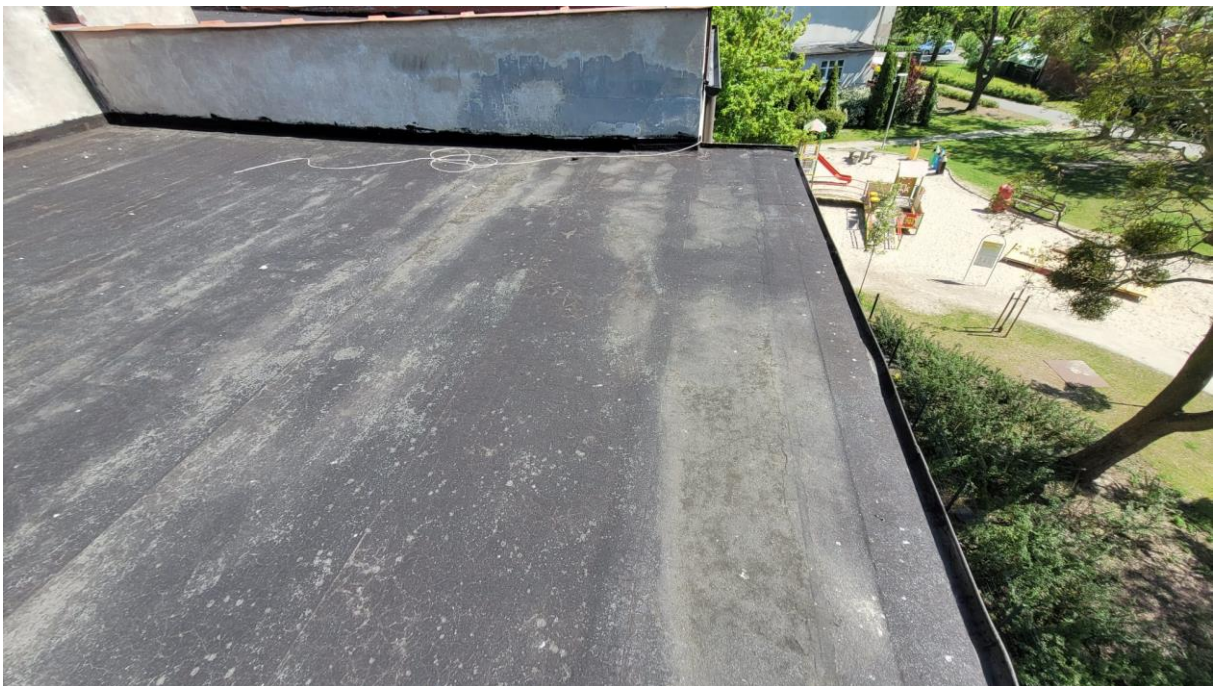
Fot. 4 Pokrycie dachowe z papy, rynny i rury spustowe – widoczne ślady lokalnych zastoisk wody, nieprawidłowe spadki powierzchniowe, zdeformowane i skorodowane rynny