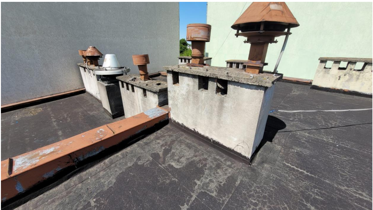
Fot. 2 Czapki kominów nasady kominowe – skorodowane elementy, naloty biologiczne, pęknięcia i lokalne odspojenia betonu