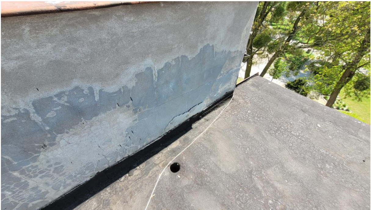
Fot. 1 Powierzchnie ścian attyki – odspojenia tynku, przebarwienia, korozja biologiczna