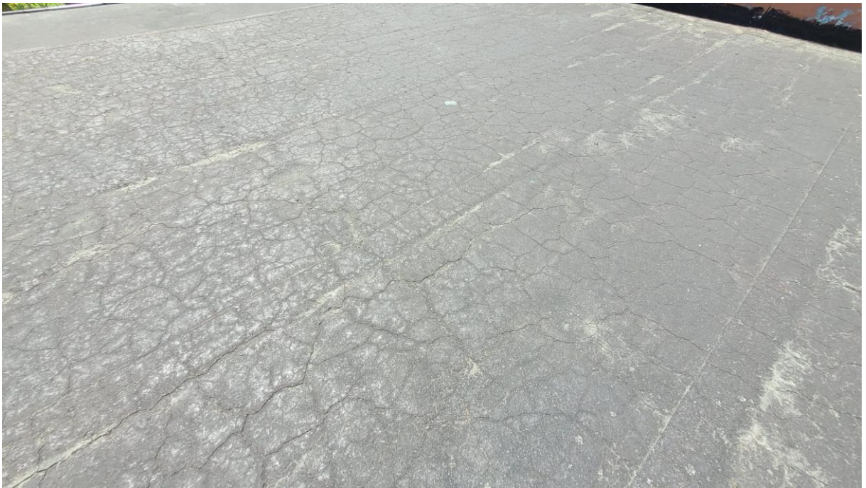
Fot. 3 Pokrycie dachowe z papy – spękana, zarysowana i odbarwiona powierzchnia papy