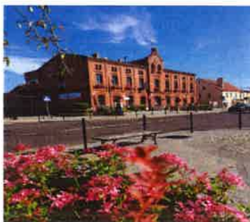
Fotografia nr 1 Urząd Miejski w Solcu Kujawskim

Gminny Program Opieki nad Zabytkami ma charakter dokumentu uzupełniającego w stosunku do aktów planowania obejmujących działania na terenie całego kraju, jak i dokumentów planowania o zasięgu lokalnym.