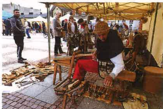
Fotografia nr 32-33 Festyn Garncarski

również koncert w wykonaniu Orkiestry Dętej OSP oraz toruńskiego zespołu Agregandado.