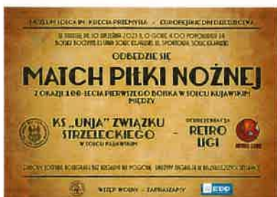
Match Piłki Nożnej w ramach Europejskich Dni Dziedzictwa