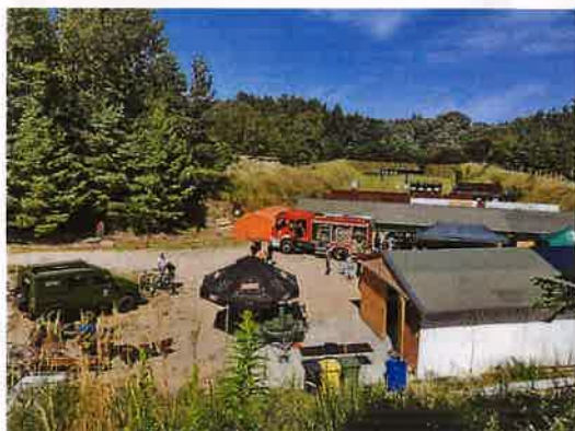
Fotografia nr 34-35 Piknik Strzelecki

12 sierpnia na terenie strzelnicy Kurkowego Bractwa Strzeleckiego w Przyłubiu odbył się „Piknik Strzelecki” zorganizowany z okazji Święta Wojska Polskiego. Podczas imprezy mieszkańcy mieli okazję popróbować swoich sił w strzelaniu z KBKS, pistoletu sportowego oraz w strzelaniu z łuku sportowego. Dodatkową atrakcją dla uczestników pikniku stanowiły: wóz strażacki Ochotniczej Straży Pożarnej w Solcu Kujawskim, stoisko z bronią Kurkowego Bractwa Strzeleckiego w Solcu Kujawskim, stoisko GRS OP Bizon oraz stoisko Komendy Miejskiej Policji w Bydgoszczy.