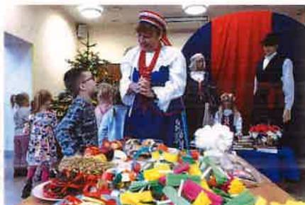
Fotografie nr 15-20 Projekt „Poczuj Kujawy”

Od września 2023 r. po raz pierwszy dla mieszkańców Solca Kujawskiego zrealizowano projekt „Poczuj Kujawy”, którego celem była promocja i odkrywanie kultury, historii i dziedzictwa kulturowego Kujaw. Podczas projektu, który trwał do 31.10.2023 r. zorganizowano wiele warsztatów, w trakcie których uczestnicy mieli możliwość poznania charakterystycznych cech Kujaw. W trakcie realizowanych zajęć przeprowadzono prelekcję na temat kultury Kujaw, zwyczajów oraz stroju kujawskiego, warsztaty rękodzieła oraz naukę tańca kujawskiego. Część działań była skierowana do osób niepełnosprawnych, w związku z powyższym w zajęciach wzięli udział podopieczni Warsztatu Terapii Zajęciowej oraz podopieczni Środowiskowego Domu Samopomocy. Koszt dofinansowania realizowanego projektu wyniósł 5 000 zł.