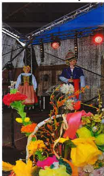
Fotografia nr 29 - 31 Jarmark Wielkanocny

1 kwietnia na Placu Jana Pawła II odbył się pierwszy Jarmark Wielkanocny, w trakcie którego na odwiedzających czekało wiele atrakcji. Dla dzieci przygotowano warsztaty i animacje oraz zagrody z żywymi kurami i kurczakami. Wszyscy mieszkańcy mogli rozgrzać się ciepłym żurkiem wielkanocnym, a także stawiać pierwsze kroki rodzimego tańca „Kujawiaka” pod czujnym okiem instruktorów z zespołu ludowego.