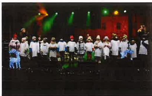
Fotografia nr 40- 42 Rodzinny Jarmark Świąteczny