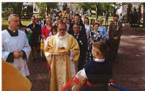
Fotografia nr 36-37 Dożynki Gminne

9 września na terenie miasta odbyły się „Dożynki gminne”. Część obrzędową uroczystości poprzedziła uroczysta msza święta odprawiona w kościele pw. św. Stanisława Biskupa i Męczennika. Po zakończonym nabożeństwie korowód dożynkowy udał się na parking przy Ośrodku Sportu i Rekreacji gdzie odbyły się dalsze uroczystości. Po ceremoniale dożynkowym, zgodnie z przyjętym zwyczajem nagrodzono zwycięzców konkursu na „Najładniejszą kompozycję dożynkową”. W dalszej części artystycznej programu wystąpili zaproszeni wykonawcy: Zespół Solecczanie, Zespół Pieśni i Tańca Młody Toruń, Zespół Pieśni i Tańca Ziemi Kutnowskiej, Zespół „O to chodzi” oraz Zespół Turnioki. Na zakończenie dożynek odbyła się potańcówka kujawska.